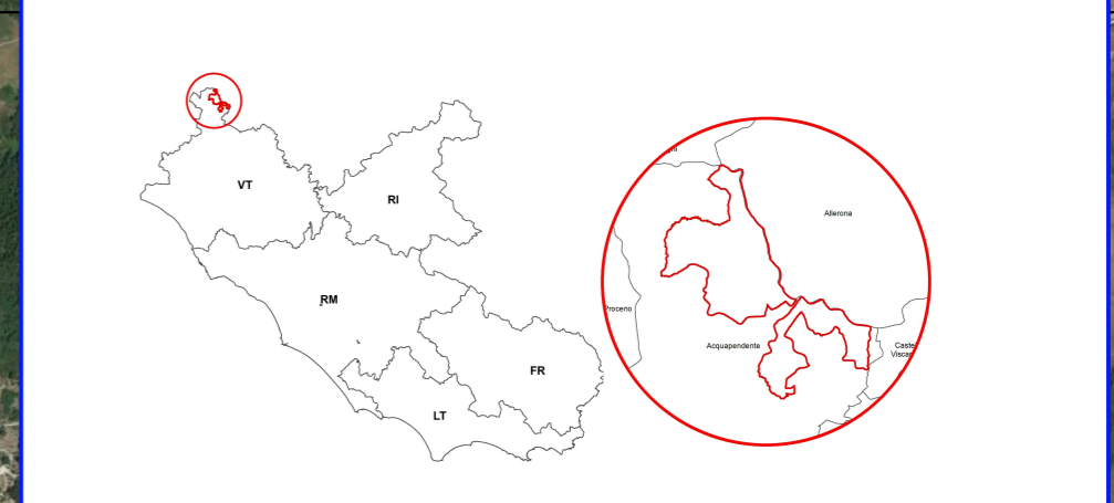
Tavola 2 Foglio L76 DRAC