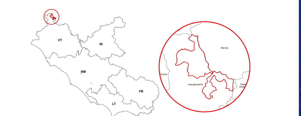
Tavola 6 Foglio 2/2

0 250 500 m Scala 1 : 10.000 Coord. X,Y - Datum WGS84 - 32N